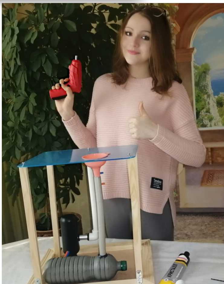
Приложение 17. Система сбора дождевой воды.