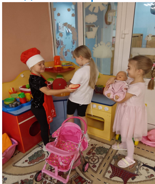
Сюжетно-ролевая игра: Дочки-матери