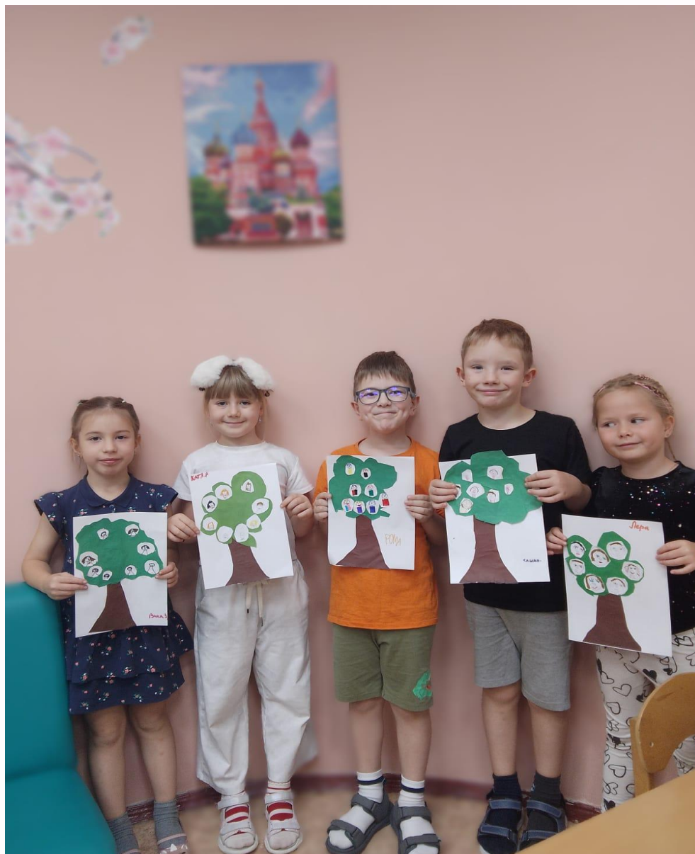
Аппликация: Генеологическое древо