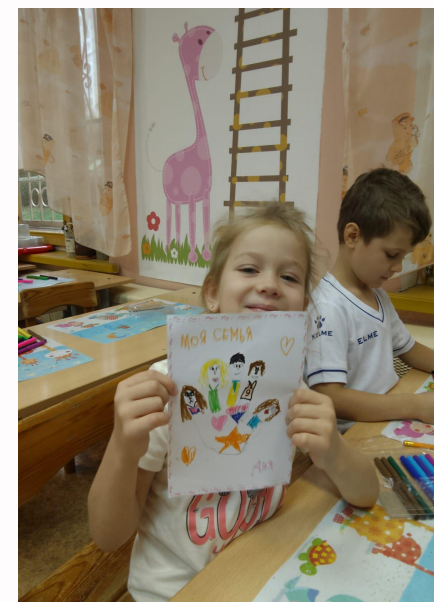
Рисование: Моя рука- моя семья