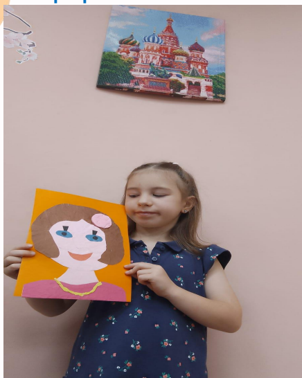
Портрет: Моя мама