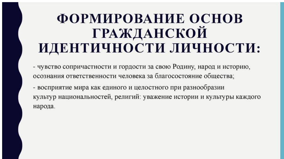
Рисунок 5 — Схема формирования основ гражданской идентичности через историческое образование

Осознание своей идентичности требует развития критического мышления.