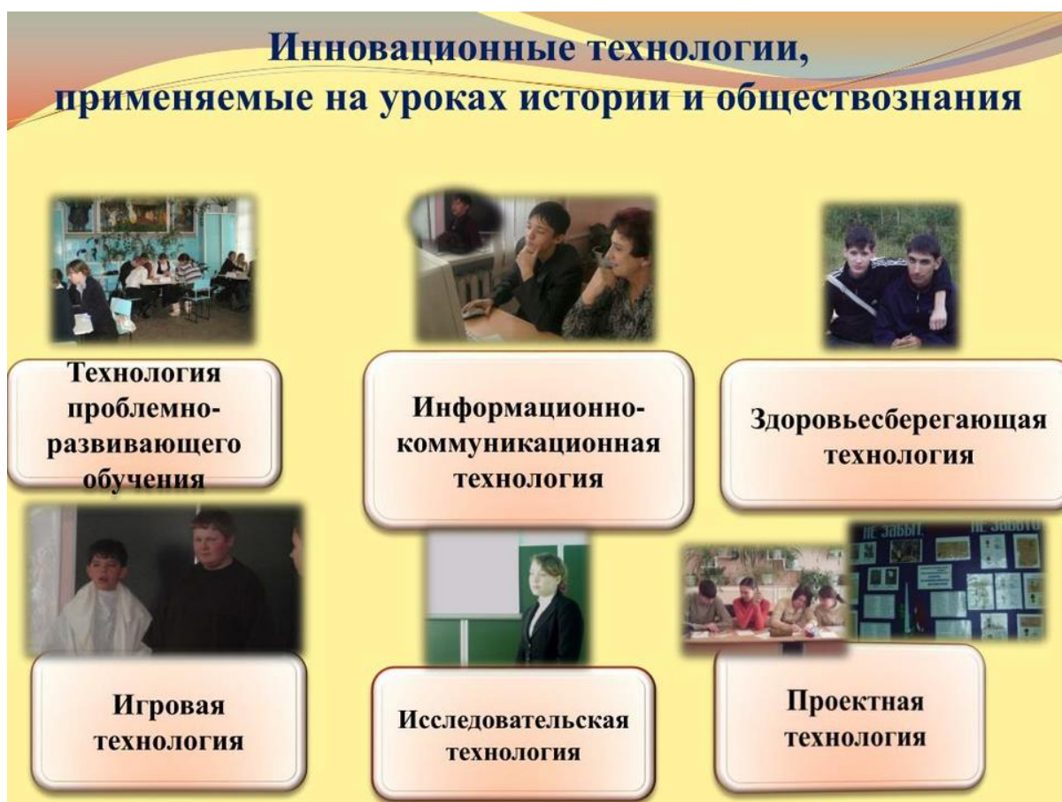
Рисунок 8 — Схема инновационных технологий, применяемых на уроках истории и обществознания

Таким образом, инновационные технологии и интерактивные методы в преподавании истории трансформируют восприятие предмета — из пассивного запоминания фактов в активный, вовлечённый и осмысленный процесс познания. Использование интерактивных методов способствует глубокому пониманию исторических процессов школьниками.