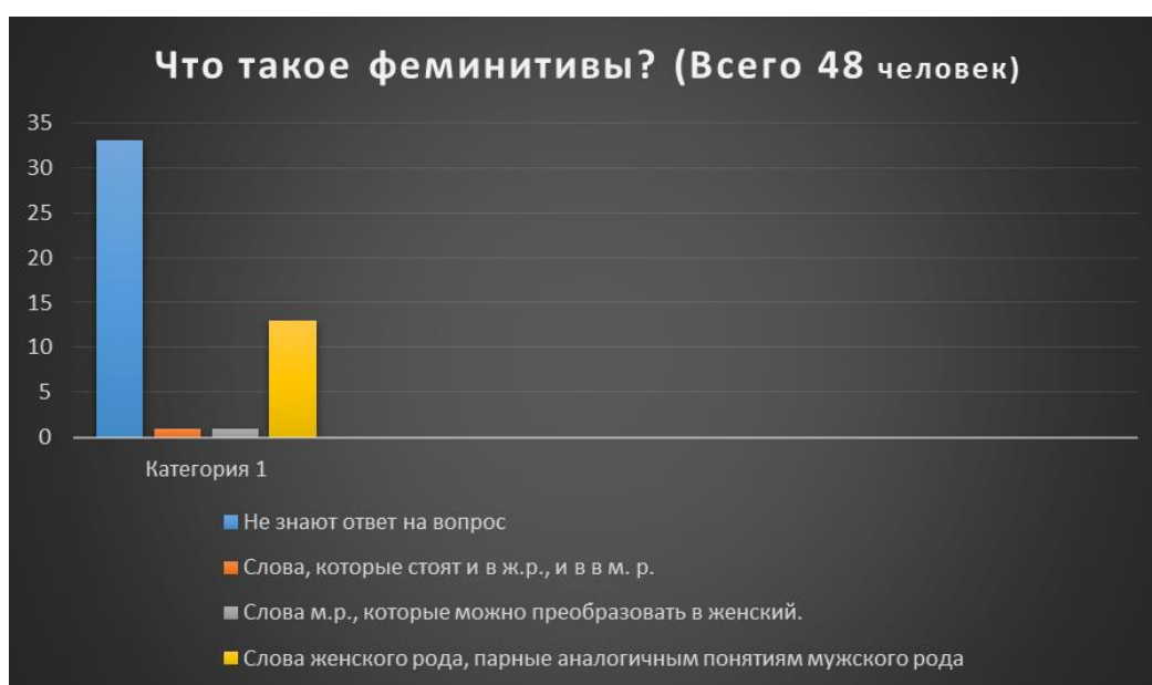
Гистограмма № 1