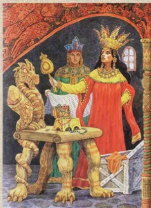
Злая царица, Сказка о мертвой царевне и о семи богатырях

Свет мой, зеркальце! скажи Да всю правду доложи: Я ль на свете всех милее, Всех румяней и белее?