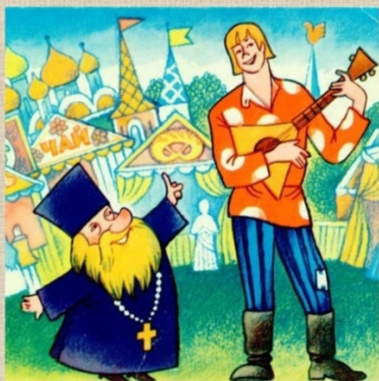
Сказка о попе и о работнике его Балде

Дети предлагают варианты ответов. Правильность ответа проверяется по клику мышки, появляется иллюстрация к «Сказке о попе и о работнике его Балде» и название сказки.