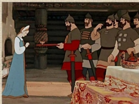
Сказка о мёртвой царевне и о семи богатырях

Дети высказывают свои предположения. Воспитатель проверяет правильность ответа. По клику мышки текст исчезает и появляется иллюстрация к «Сказке о мертвой царевне и о семи богатырях» и название сказки.