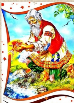
Сказка о рыбаке и рыбке

Слайд 12. Воспитатель зачитывает отрывок из «Сказки о рыбаке и рыбке», предлагает детям назвать, из какой сказки этот отрывок.