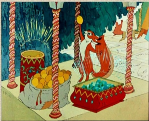
Сказка о царе Салтане