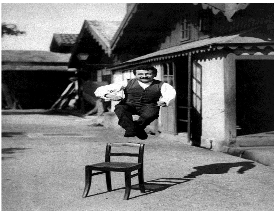
Огюст Люмьер в прыжке, 1888 год.

Мир братьев вращался вокруг фотографии: они не только помогали отцу в фабричных делах, но и любили экспериментировать со съёмкой. Особенно Люмьеров привлекали снимки в движении.