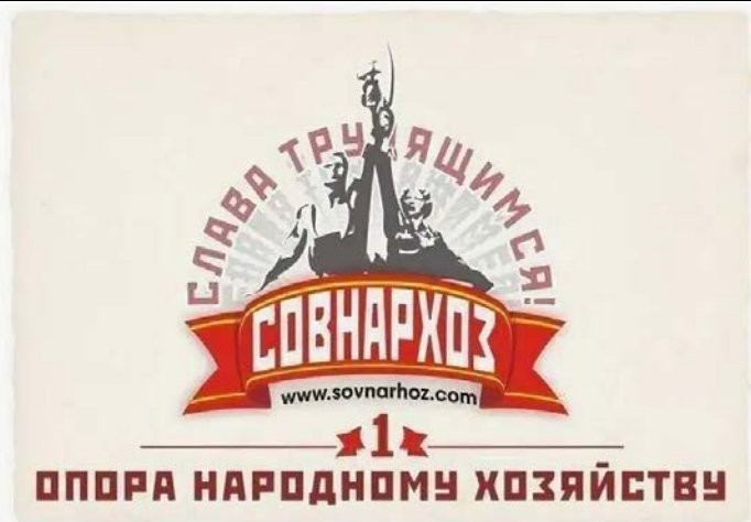
1957 г. – замена министерств совнархозами