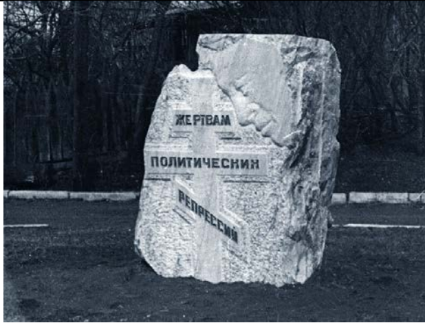
Реабилитация жертв политических репрессий