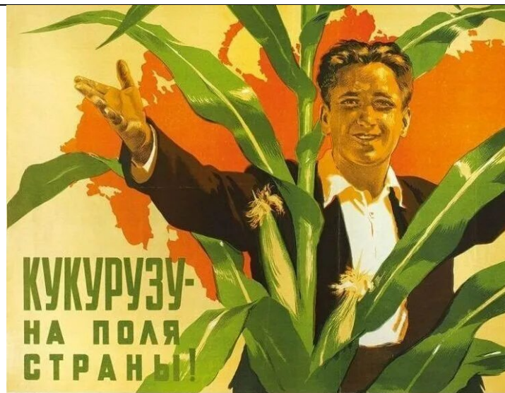
Внедрение кукурузы в сельское хозяйство