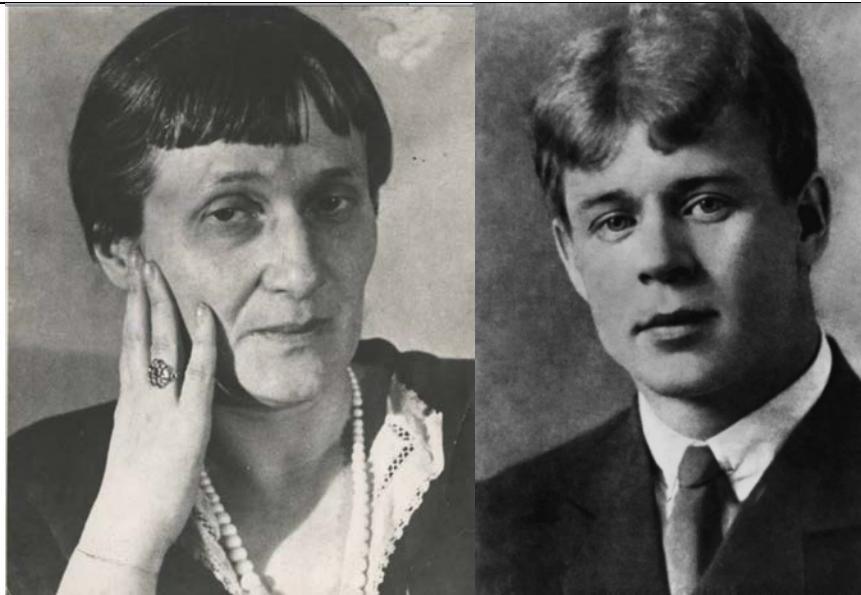
Реабилитация некоторых деятелей культуры ( А. Ахматова, М. Цветаева, С. Есенин)