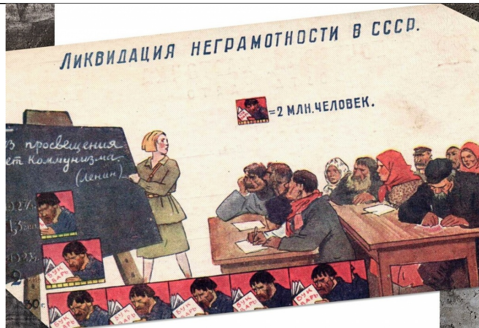
Рост грамотности населения