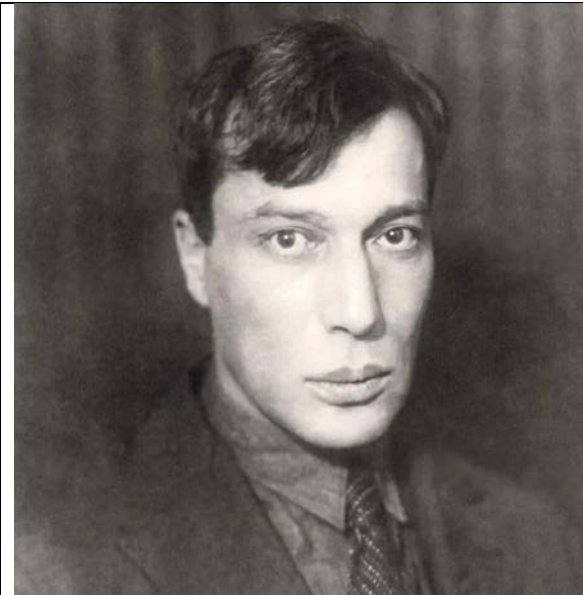
Травля Б. Пастернака