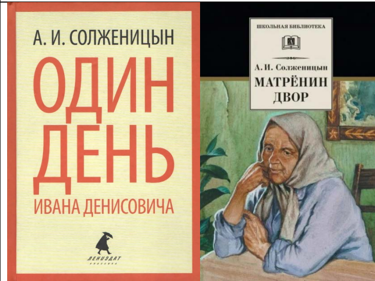
Публикации произведений А. Солженицына