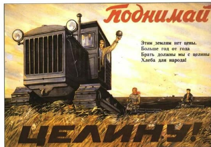
1954 г. – начало освоения целины