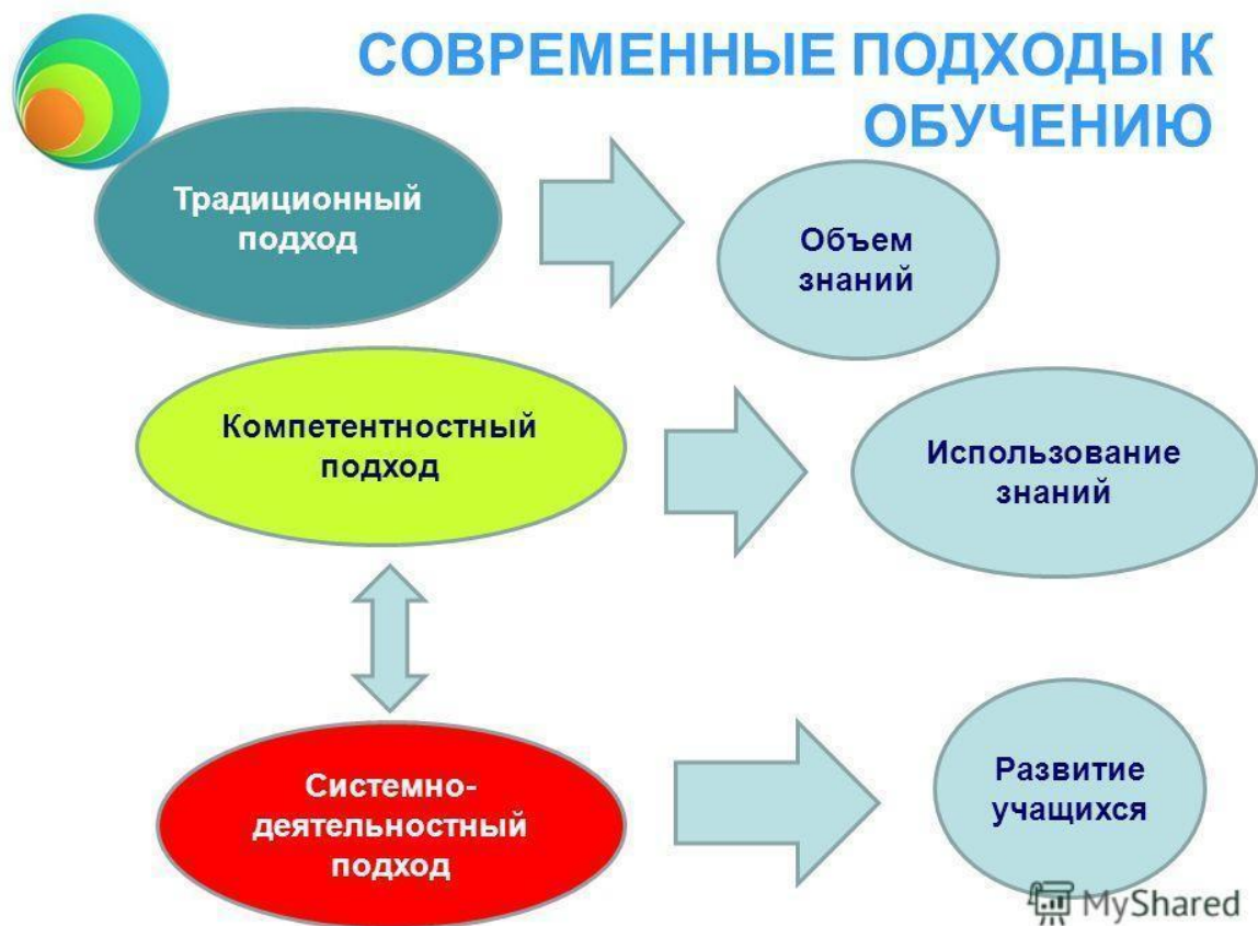
Рисунок 7. Интеграция подходов к развитию информационной и лексикографической грамотности