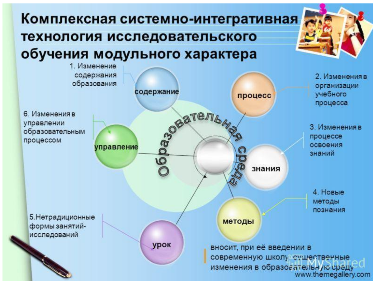
Рисунок 8. Интеграция подходов к развитию информационной и лексикографической грамотности

Развитие информационной и лексикографической грамотности обучающихся на уроках русского языка требует комплексного подхода. Этот подход объединяет различные аспекты образовательной деятельности, обеспечивая целостное восприятие процесса обучения и воспитания [31]. Важно учитывать взаимодействие элементов образовательной системы, включая цели, задачи, содержание и методы преподавания, чтобы обеспечить не только усвоение знаний, но и формирование умений работать с информацией [32].