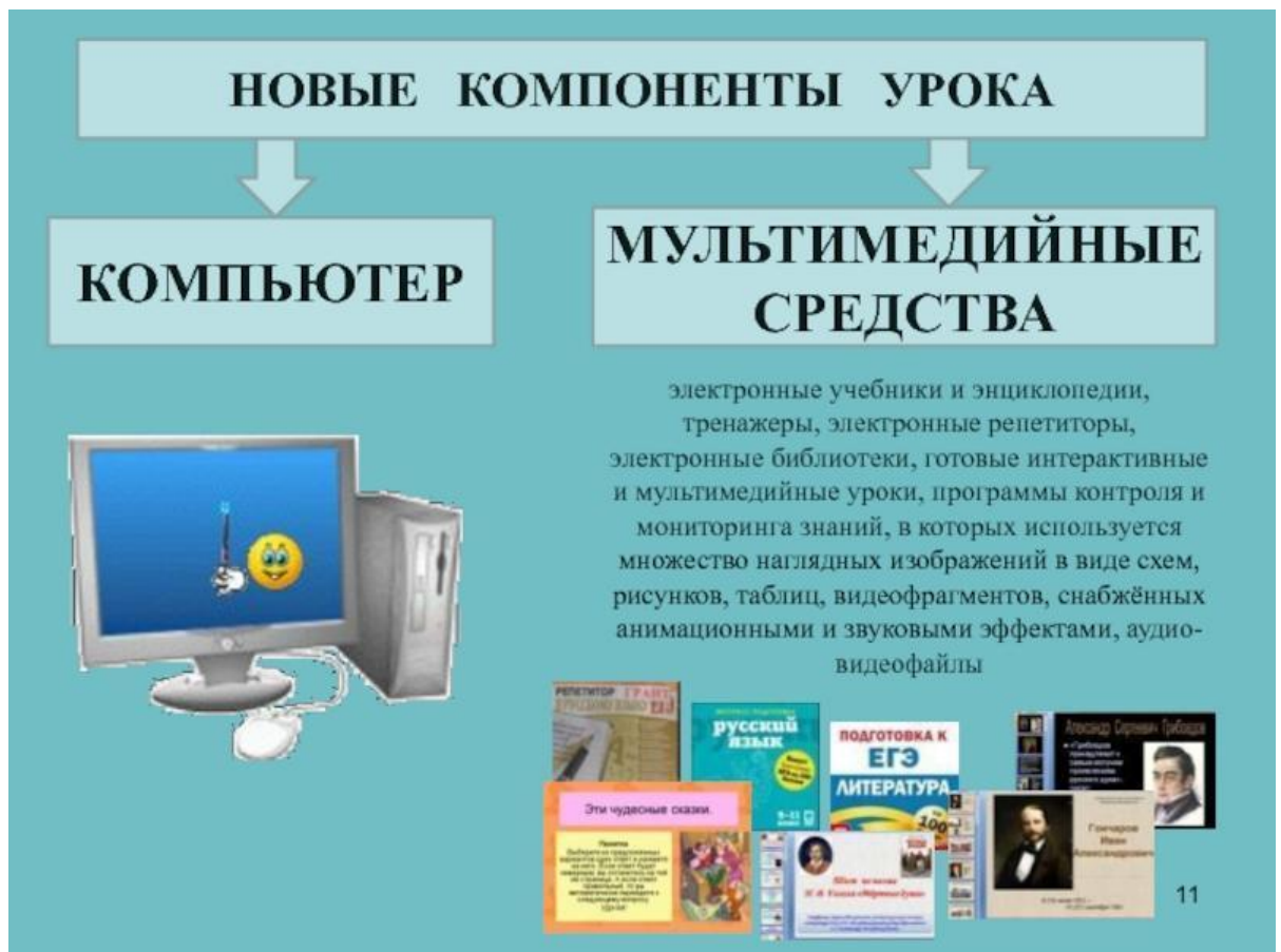
Рисунок 3. Интеграция мультимедийных средств в обучение русскому языку