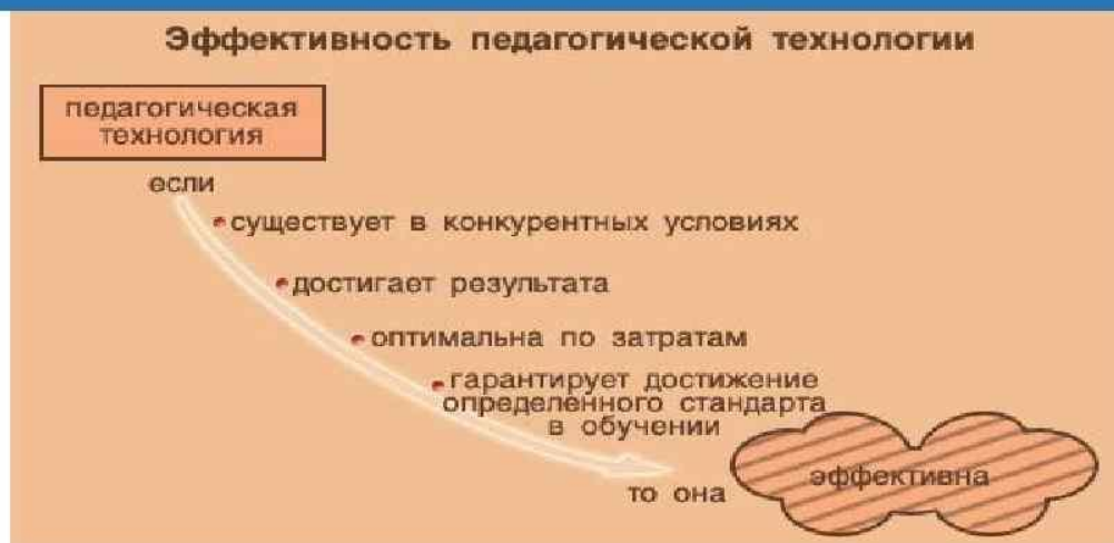
Рисунок 6. Критерии и эффективность использования педагогических технологий

Развитие информационной и лексикографической грамотности студентов на уроках русского языка невозможно без интеграции современных технологий в образовательный процесс. Технологии обучения, такие как педагогические, цифровые и интерактивные подходы, позволяют не только модернизировать процесс усвоения знаний, но и повышают его эффективность. Внедрение современных педагогических технологий (СПТ) предоставляет возможность учитывать индивидуальные особенности и потребности обучающихся, тем самым формируя персонализированный подход [26].