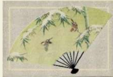
с аппликацией из ткани и тиснением