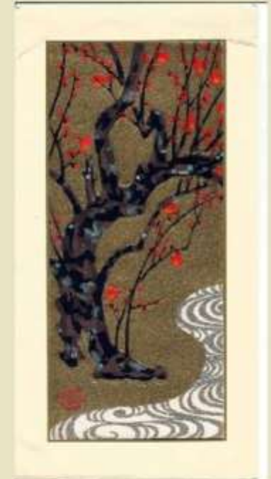
с позолотой и серебрением