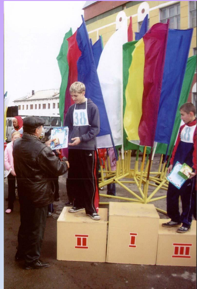
Успех во всем (2 жетона)