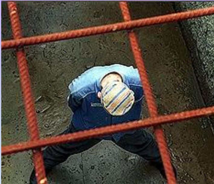
Чистая совесть (2 жетона)