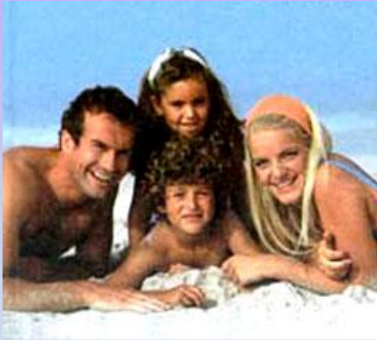
Здоровая семья (2 жетона)