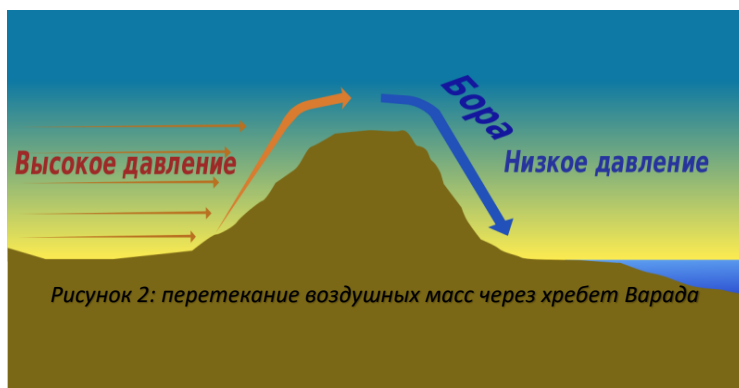
Рисунок 2: перетекание воздушных масс через хребет Варада