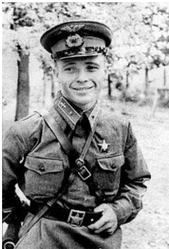
Талалихин Виктор Васильевич

В Великую Отечественную войну был заместителем командира авиаэскадрильи 177-го истребительного авиаполка.