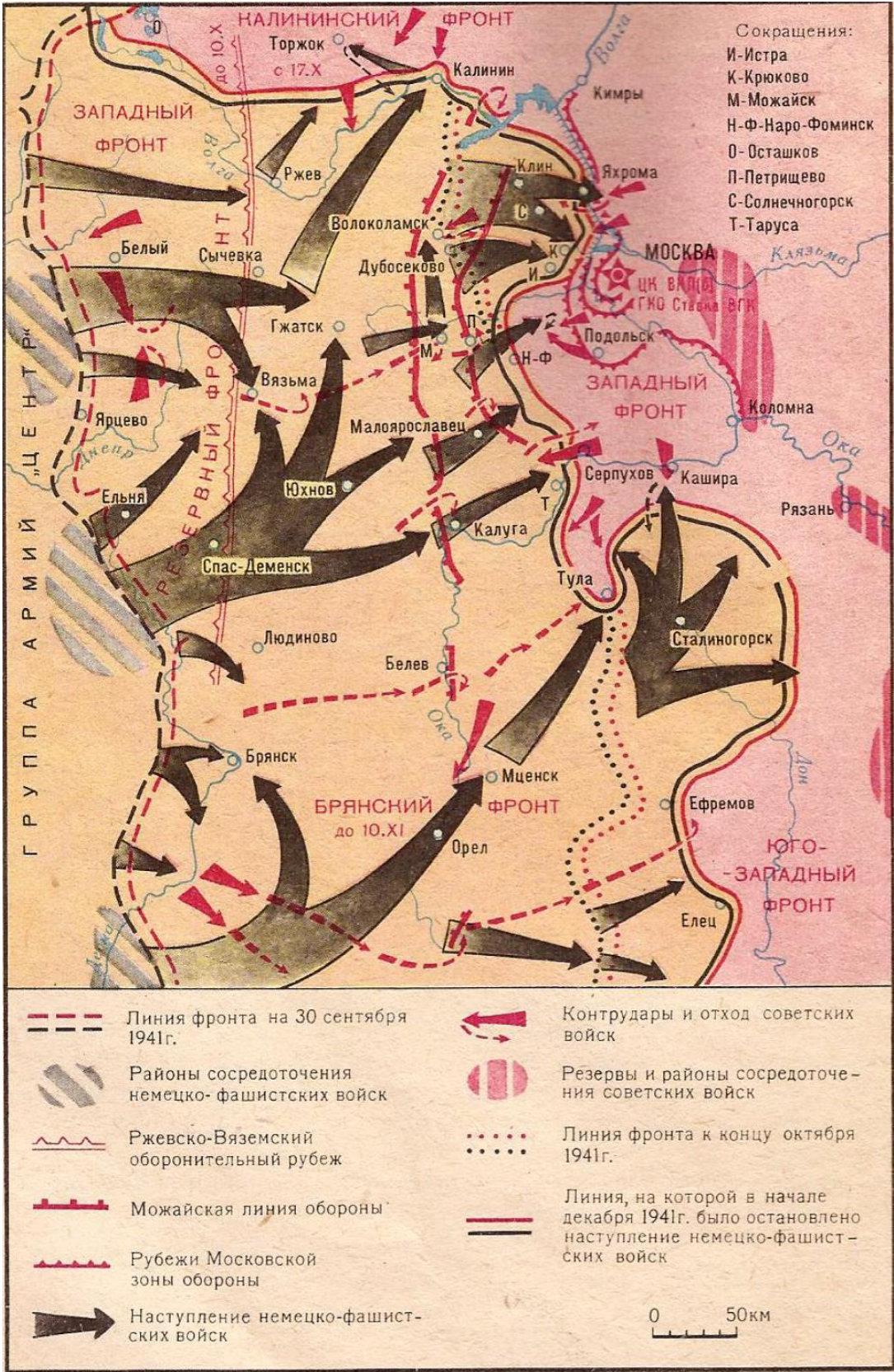
Карта 1.Оборона Москвы ( 30 сентября – 5 декабря 1941 г.)