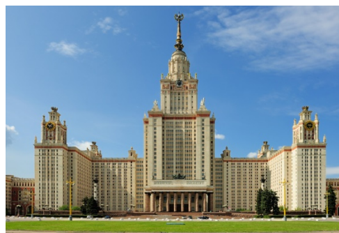
МГУ им. М.В.Ломоносова