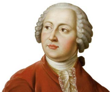
Михаил Васильевич Ломоносов