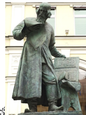
памятник в Москве