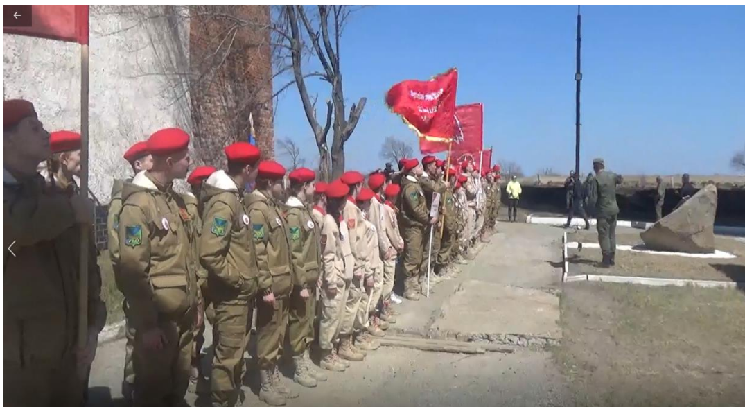
«УЧАСТИЕ В МИТИНГЕ, ПОСВЯЩЕННОМ ОКОНЧАНИЮ 2 МИРОЙ ВОЙНЫ»