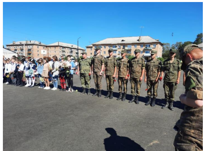
«УЧАСТИЕ В МИТИНГЕ, ПОСВЯЩЕННОМ ОКОНЧАНИЮ 2 МИРОЙ ВОЙНЫ»