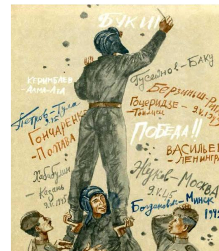
Кто брал Берлин