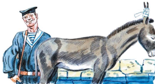
Серьги для ослика