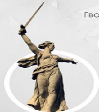
Скульпту́ра «Роди́на- ма́ть зовѣт!»