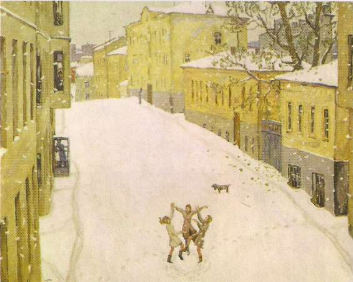
И.А. Попов «Первый снег», «Московский двор» 60-70 –е годы XX века