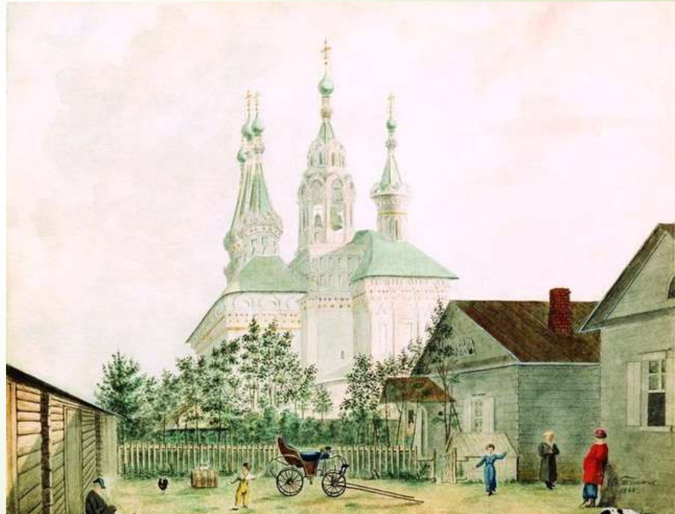
В.Д. Поленов «Московский дворик» 1878 г.