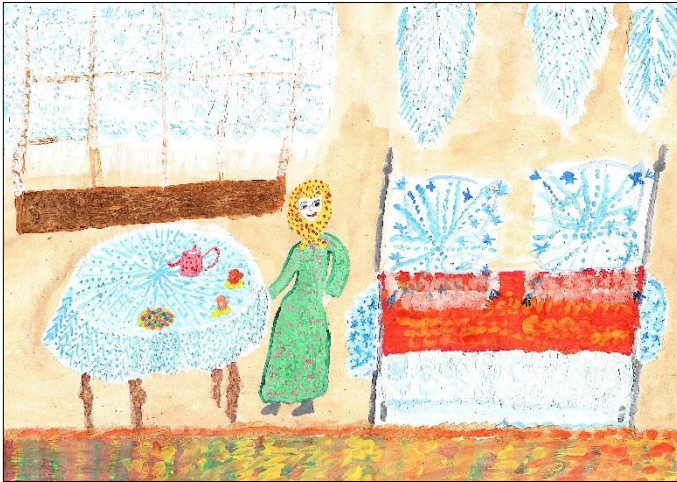
ПРАБАБУШКА ЖДЁТ НАС В ГОСТИ.