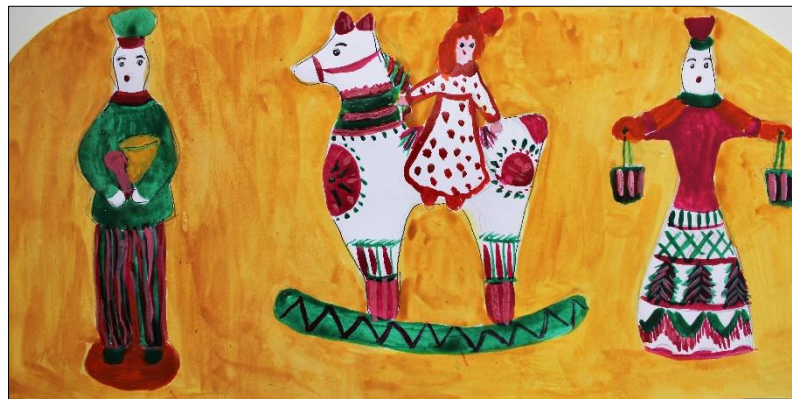
Я ЛЮБЛЮ СВОЮ ЛОШАДКУ