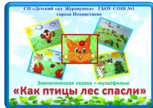
«КАК ПТИЦЫ ЛЕС СПАСЛИ»