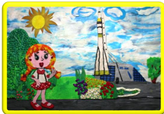
«ЧТО МЫ УЗНАЛИ О КОСМОСЕ»