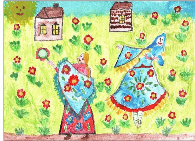
ВЕСЁЛЫЙ ПЕРЕПЛЯС В КРАСИВЫХ ПЛАТКАХ.