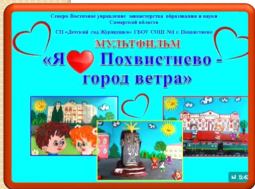
«Я ЛЮБЛЮ ПОХВИСТНЕВО-ГОРОД ВЕТРА»