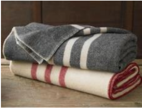
Глупый вор и умный поросенок