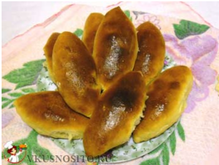
Сравнительно умная кошка