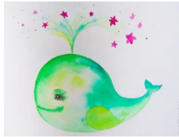
В гостях у клоуна