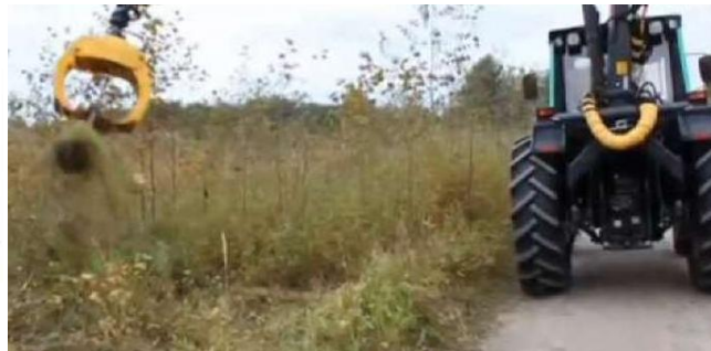
Манипуляторная машина для осветлений