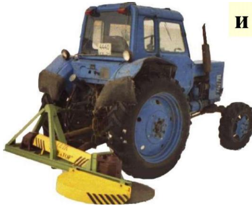
Кусторезы-осветлители лесных культур ОЛК-2

Вопрос 3: Для чего применяется при осветлениях манипуляторная машина?