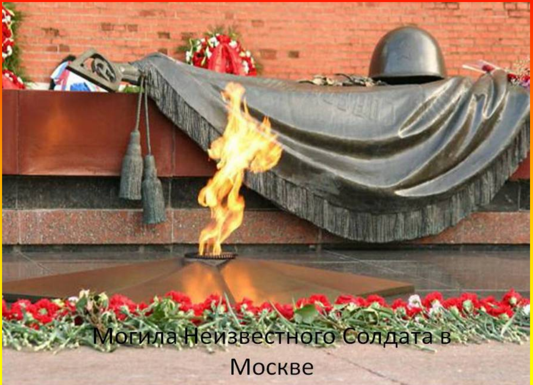
Могила Неизвестного Солдата в Москве