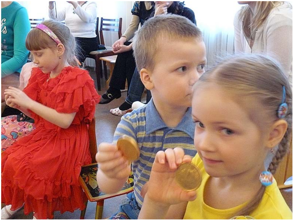
Коллективная фотография на память о проекте