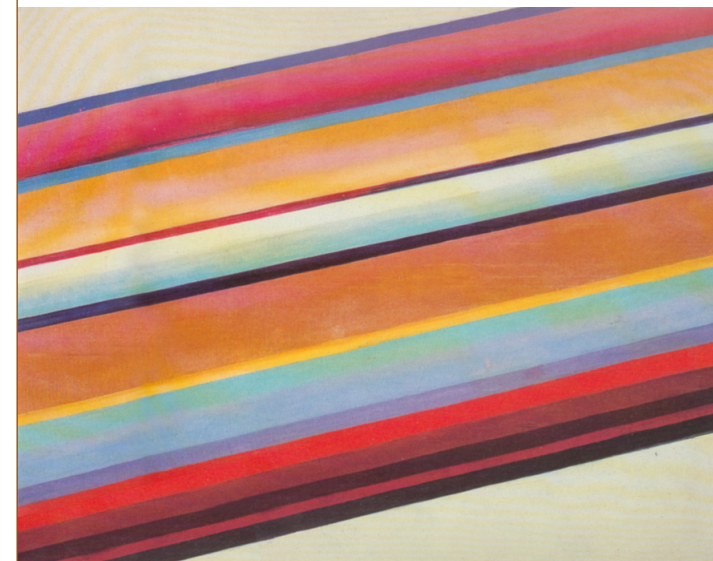
Михаил Матюшин. Движение в пространстве. 1922

Что в предложенном произведении произвело на вас наибольшее впечатление и почему?