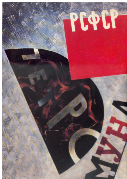
Натан Альтман. Петрокоммуна. 1921

Что в предложенном произведении произвело на вас наибольшее впечатление и почему?