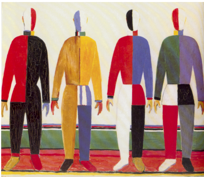
Казимир Малевич. Спортсмены. 1928 – 1932

Что в предложенном произведении произвело на вас наибольшее впечатление и почему?