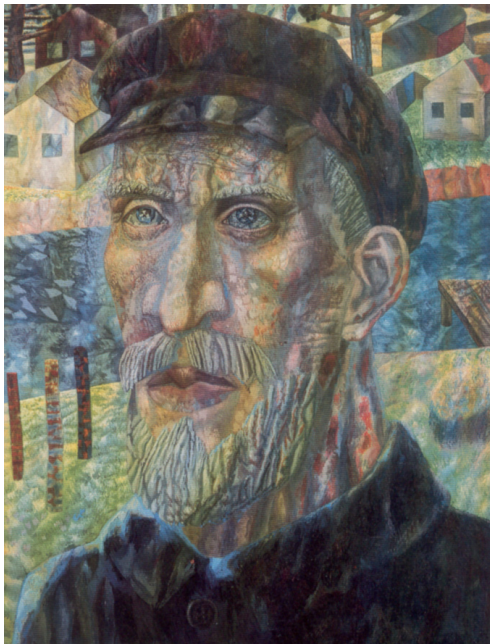
Павел Филонов. Колхозник. 1931

Что в предложенном произведении произвело на вас наибольшее впечатление и почему?