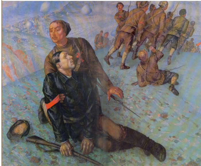
Кузьма Петров-Водкин. Смерть комиссара. 1928

Что в предложенном произведении произвело на вас наибольшее впечатление и почему?