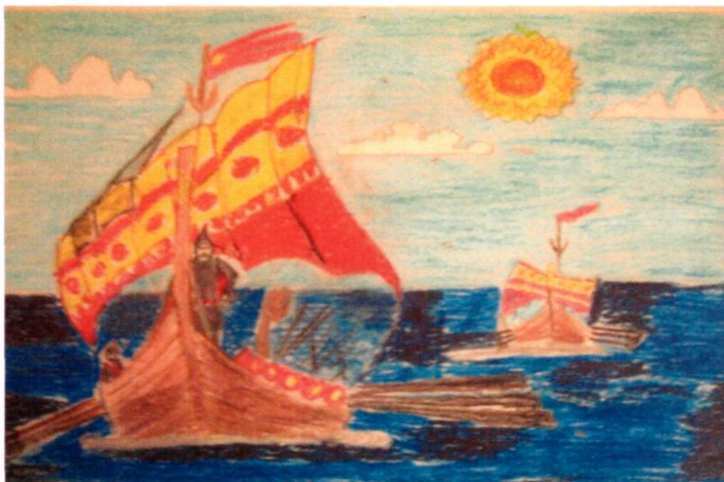
«Поход князя Олега на Царьград». Восковые мелки. Янюшевич Даниил. 10 лет.

(Комментарий юного художника: Древнерусский князь Олег правил в Новгороде и Киеве в 9 веке. Олег собрал большое войско и повел в поход на Византию- очень богатую империю. Это историческое событие я отразил в своем рисунке. Суда плыли по морю и, поставленные на колеса, двигались на всех парусах и по суше. Греки испугались и решили откупиться. За такую военную хитрость и бескровную победу Олега прозвали «вещим» т.е. чародеем, способным творить чудеса. Византийцы согласились выплачивать дань Олегу. Это была первая победа русичей над греками, которую признали византийцы).