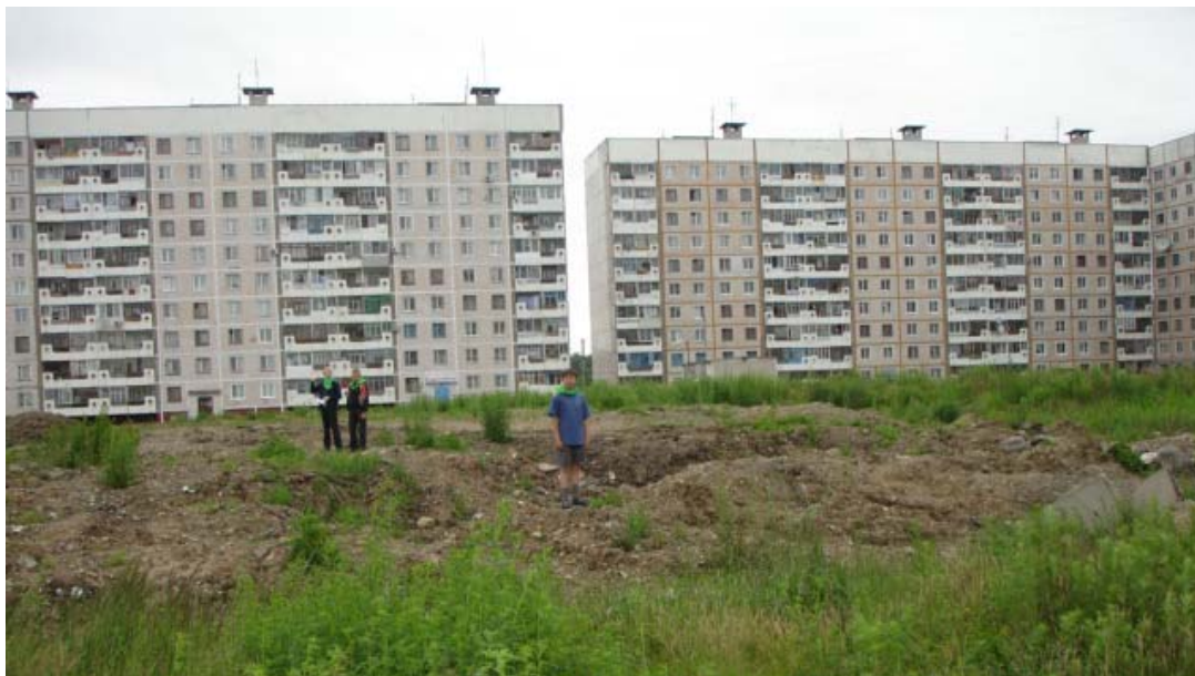
Жилмассив «Нов. Ленина», несанкционированных свалок не обнаружено.