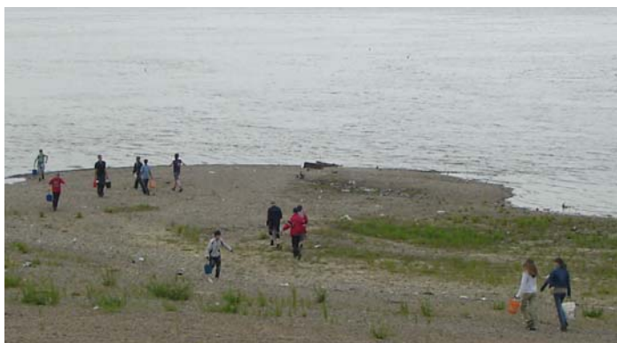
Поливаем амурской водой...