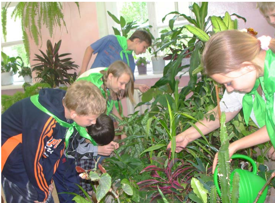
Занятия по экологии растений.