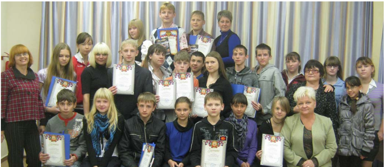
Награждение участников проекта «Экологический патруль» города Комсомольска-на-Амуре по итогам работы за лето 2010 года