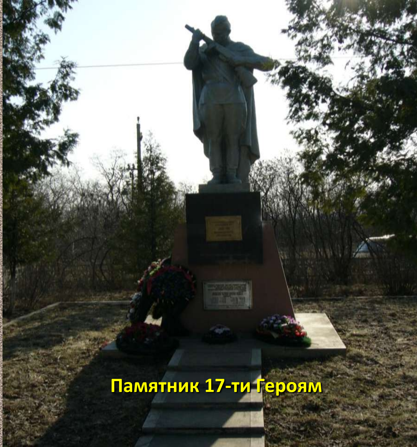
Памятник 17-ти Героям