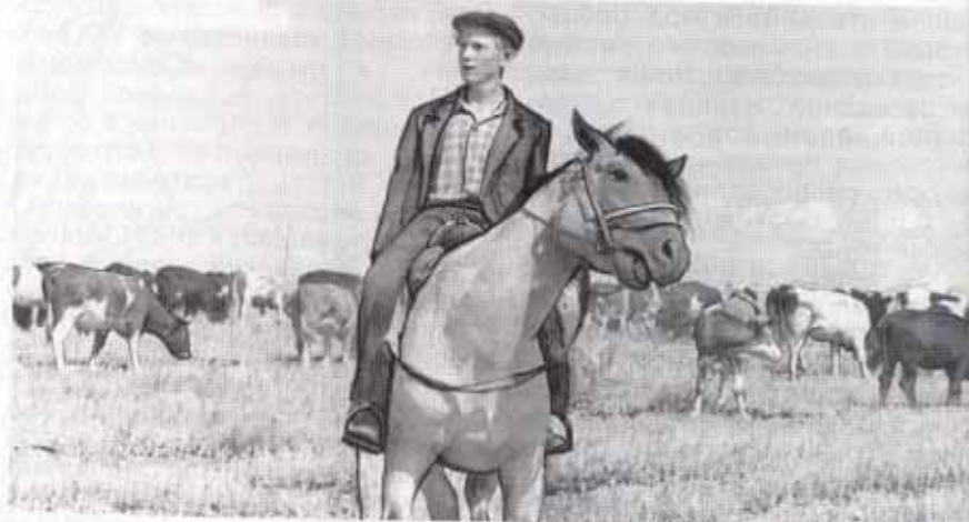
Колхозный пастух. Фото 1960-х гг.

Однако «великого перелома» не получилось: принудительное раскрестьянивание и непосильные налоги быстро подорвали экономику общественных хозяйств. В 1950 г. предпринимается попытка спасти положение путем укрупнения мелких артелей. После их слияния количество колхозов со 147 уменьшилось до 36, а в 1954 г. их стало 32. Но и эти меры не привели к рентабельности сельскохозяйственного производства, и с 1960 по 1981 гг. все нерентабельные колхозы (кроме одного — «Память Ильича») были преобразованы в совхозы, а те, в свою очередь, после 1991 г. реформированы в акционерные общества. В 1988 г. создан агропромышленный комбинат «Зарайский», в который вошли совхозы (затем акционерные общества) «Чулки-Соколово», «Зарайский», «40 лет Октября», «Маслово», «Большевик», «Красный колос», «Родина», «Авдеевский», «Красная звезда», имени Калинина, «Вперед к коммунизму» и колхоз «Память Ильича», а также производственные объединения «Зарайскагрохимия» и «Зарайскагропромснаб», районная государственная семенная инспекция, молочный завод, ветеринарная лаборатория, станция по борьбе с болез-