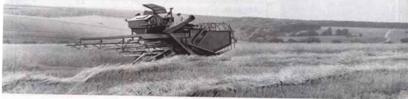
Совхоз «Красный колос». Идет жатва хлебов. Фото 1980-х гг.

С 1991 г. в районе появились первые фермерские хозяйства, через 10 лет их стало 232. Они получили земельные наделы, долгосрочные и краткосрочные кредиты.