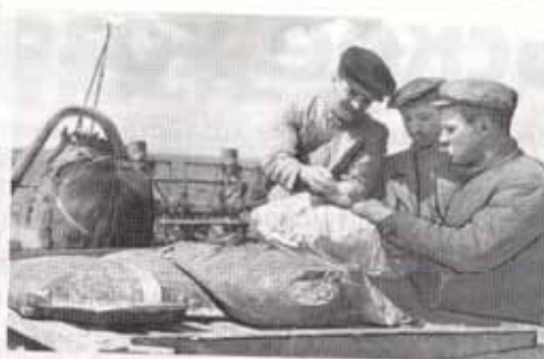
Совхоз «Чулки-Соколово». Сев кукурузы квадратно-гнездовым способом. Фото 1960-х гг.

визация охватила 6508 крестьянских хозяйств, что составляло 99,4%; создано 147 колхозов.