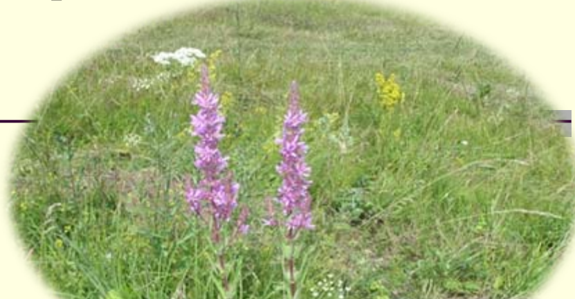
полевые растения (луг)