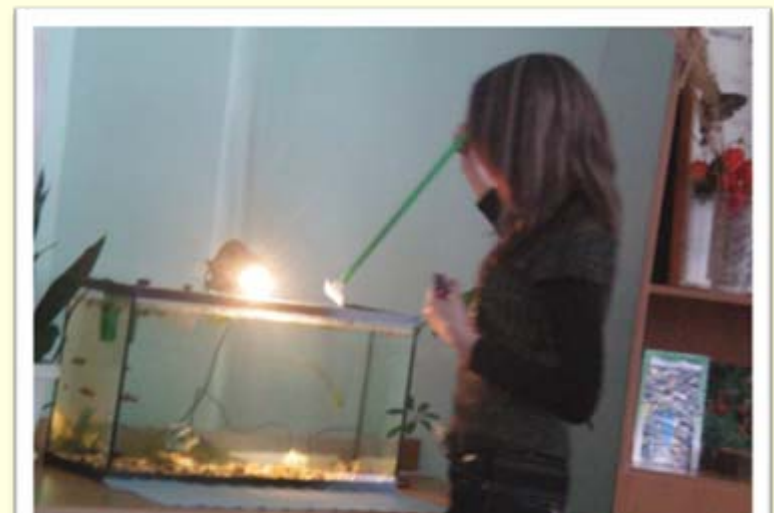
аквариум – искусственный комплекс